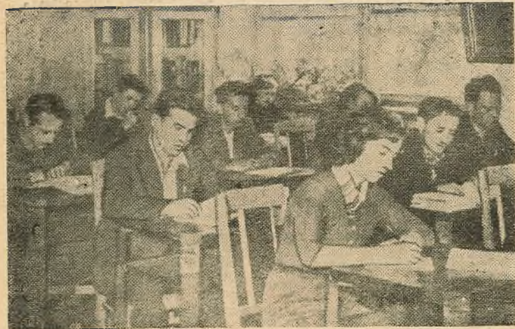
У чытальнай зале БДУ заўсёды многалюдна. Тут можна ўбачыць і студэнтаў I курса, і студэнтаў-дыпломнікаў, і старых завочнікаў.